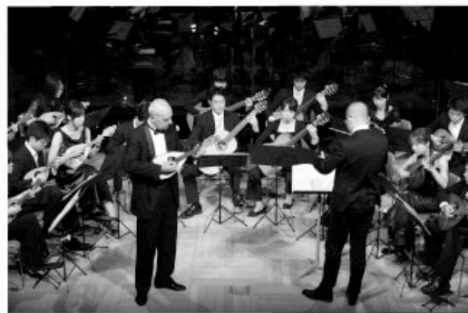
第7回大阪国際マンドリンフェスティバルより